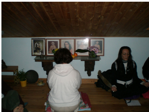
La cerimonia del mahasamadhi di Paramahansa Yogananda (2007)