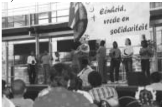
Optreden op wereldreligiedag

Nou, het is werkelijk bijna niet te geloven hoe een wonderschone wereld we hebben... Ik ben het jaar ver schillende keren afgereisd naar Bofokoele. Een reis van 4 uur met een oude vrachtwagen die als bus omgebouwd is (Van Gend en Loos onder andere!), maar niet over geasfalteerde wegen hoor! Nee; hobbel de bobbel, kedeng, kedeng! De weg is rood door de bauxiet, dus door het opstuivende zand kwam je dan ook rood aan op het haventje. Dan zoeken naar een boot (boomstam met motor) die zo ver zou gaan als Bofokoele. Het is namelijk een van de verste bestemmingen aan de Surinamerivier. Bij hoog water is de heenweg over water ook zo'n 4 uur, maar bij laag water haal je Bofokoele niet in een dag, dan moet je stukken over de rotsen lopen en door het bos als de bootmannen de boot over de sula's (stroomversnellingen) duwen en trekken, en overnachten onderweg, met alle passagiers, en 's ochtends verder reizen... Meestal ging ik naar Bofokoele voor gemiddeld 3 weken waarin een heilige dag of negentiendaagsfeest viel. Mijn doel was om de bahá'í-gemeenschap te steunen in hun (gemeenschaps-)activiteiten en de leerkrachten bij te scholen (voor zover ik dat kon...). In de praktijk zag het er ongeveer zo uit: 's Ochtends naar school om les te geven (de school heeft zo'n 75 leerlingen), vaak waren er leerkrachten afwezig. Na school met de leerkrachten werken aan 'de bijscholing' (er was maar een leerkracht met een diploma en