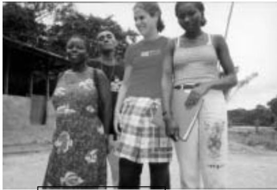
Leraren van de school

Lieve vrienden! Inmiddels ben ik alweer een tijdje terug in koud, koel, freezing Nederland. Ik was namelijk in oktober 2001 vertrokken voor een Jaar van Dienstbaarheid aldaar. Ik ben sinds oktober weer terug om me voor te bereiden op een langer verblijf in Suriname! Ja, het jaar is Zooooo goed geweest! Ik wil jullie er graag iets over vertellen en hoop ook van harte dat er onder jullie mensen zullen zijn die OOK NAAR SURINAME willen gaan! Wellicht voor een Jaar van Dienstbaarheid??!!