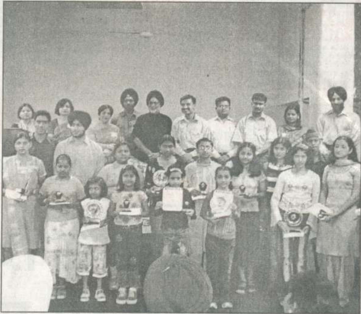
ਚੰਡੀਗੜ੍ਹ : ਚੰਡੀਗੜ੍ਹ 'ਚ ਬਰਨਿੰਗ ਬਰੇਨ ਸੋਸਾਇਟੀ ਵੱਲੋਂ ਤੰਬਾਕੂ ਤੇ ਸਿਗਰਟਨੋਸ਼ੀ ਖਿਲਾਫ ਸਰਗਰਮ 37 ਜਣਿਆਂ ਨੂੰ ਸਨਮਾਨਿਤ ਕੀਤਾ ਗਿਆ।