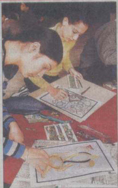
आर्ट गैलरी सेक्टर-10 में पेंटिंग बनाती छात्राएं।