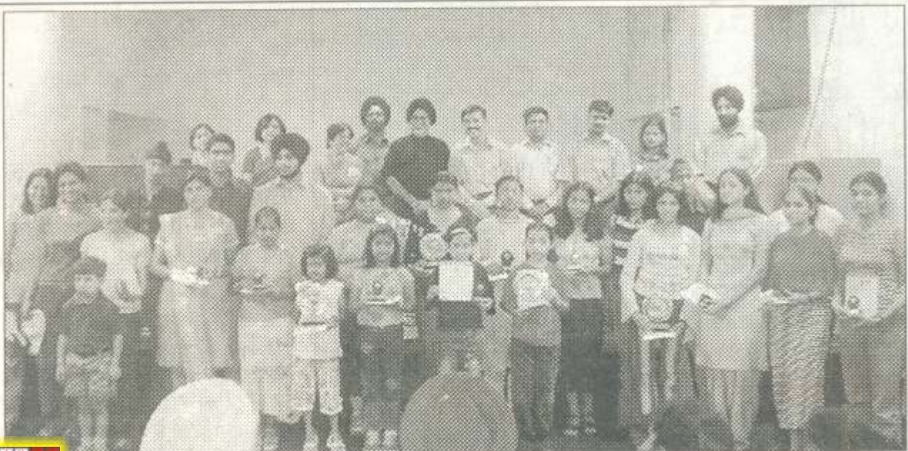
बर्निंग ब्रेन सोसायटी द्वारा आयोजित चित्रकला प्रतियोगिता में विजेता मुख्यातिथि के साथ।