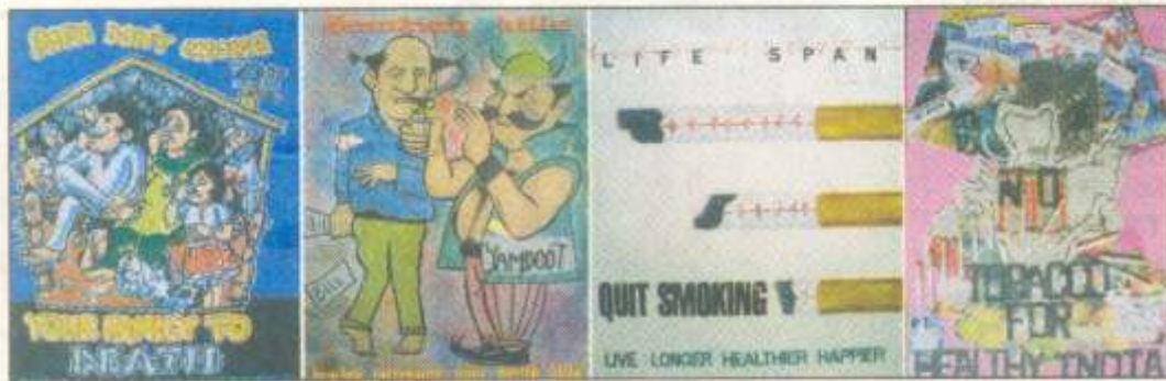
Some prize-winning entries of the Burning Brain poster-making competition on "ill-effects and consequences of tobacco."