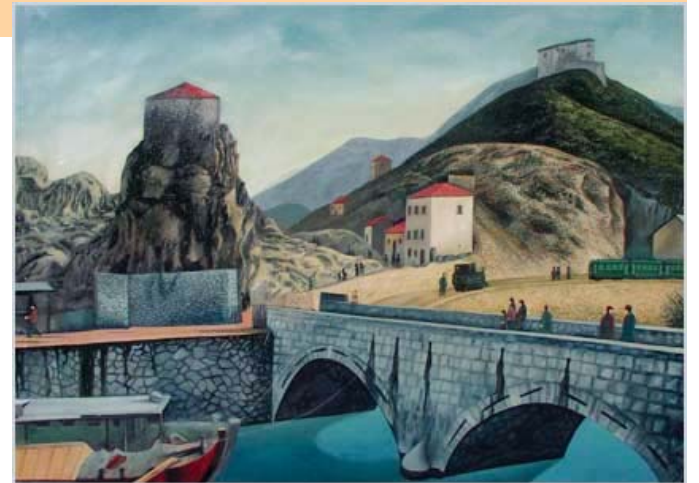
Virpazar, Stara Crna Gora

Ko je i kada sagradio ovu džamiju za sada nije poznato,