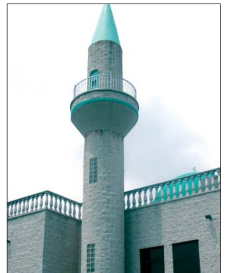
Džamija Albansko-američkog islamskog centra u Kvinsu

Delegacija je posjetila i medresu u izgradnji u Milješu.