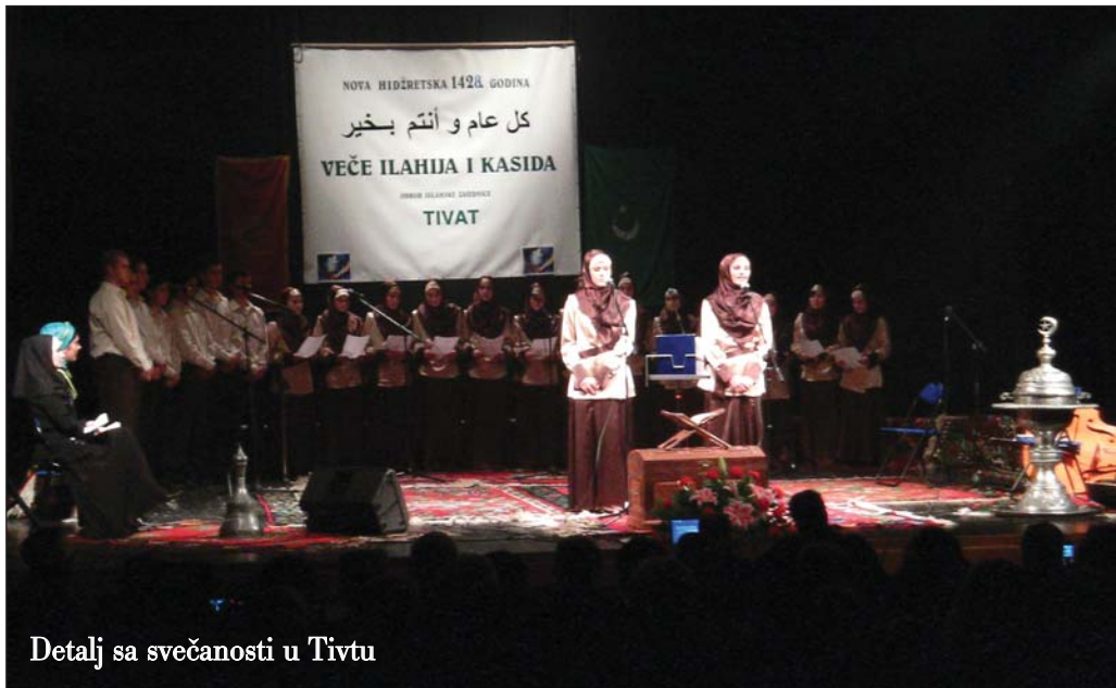
Detalj sa svečanosti u Tivtu

Svečanom akademijom i večeri ilahija i kasida u preponoj dvorani Centra za kulturu u Tivtu, 21. januara ove godine, obilježena je Nova hidžretska 1428. godina i promovisano osnivanje novouspostavljenog džemata Islamske zajednice za Boku i Budvu.