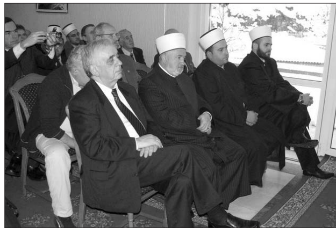
Detalj sa donatorske konferencije u Pljevljima

- Ima pomaka. Ferhadija u Banja Luci je završila prvu fazu obnove. Sada pripremamo drugu fazu. A ta prva faza se sastoji u tome što smo ove godine izvršili sanaciju temelja i ustanovili da je statika Ferhadije dobra. Na proljeće startujemo sa, ako Bog da, zidanjem Ferhadije dža-