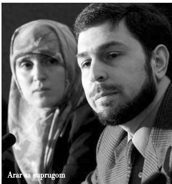
Arar sa suprugom

"Mi razumijemo da je islam dio Njemačke sa svim jednakim pravima. Ali, to takođe znači da muslimani moraju, sa svoje strane, prihvatiti osnovna prava i obaveze koji su dio našeg društva," dodao je on. Političar iz Hrišćansko demokratske partije objasnio je da Berlin želi da započne i promovise "međukulturni i međureligijski dijalog u okviru Evropske unije."