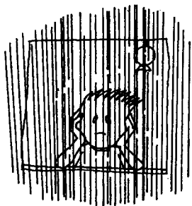
1. ( )