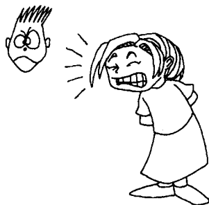
5. ( )