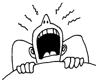
2. ( )