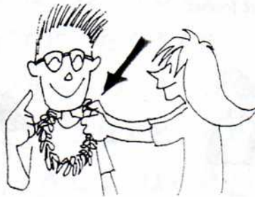
5. くれます [くれる/くれて]