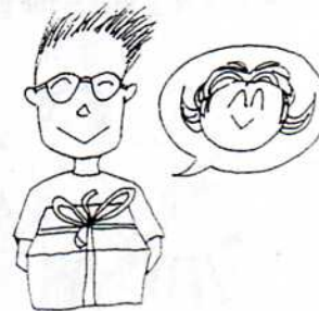
6. もらいます [もらう/もらって]