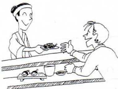
9. すしや sushi shop/bar