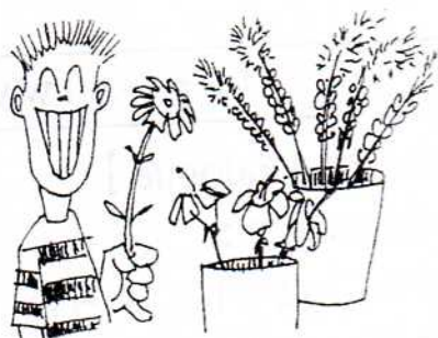
8. はなや flower shop