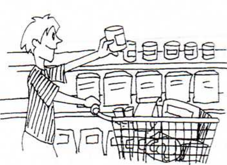
6. スーパー supermarket