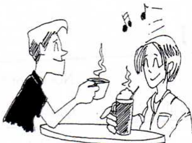
10. きっさてん coffee shop