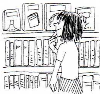
7. ほんや bookstore