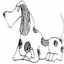
10. いぬ dog