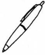
2. ボールペン BOORUPEN ballpoint pen