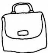
1.*かばん *KABAN bag, briefcase