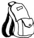
11. バッグ BAGGU bag