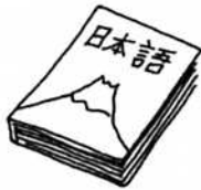
6. きょうかしょ / テキスト KYOOKASHO / TEKISUTO textbook