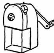
4.*えんぴつけずり *ENPITSUKEZURI pencil sharpener