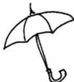
3.*かさ *KASA umbrella