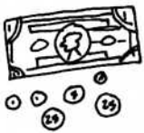
9. (お) かね (O) KANE money