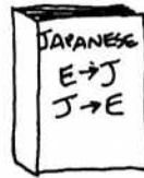
7. じしょ JISHO dictionary