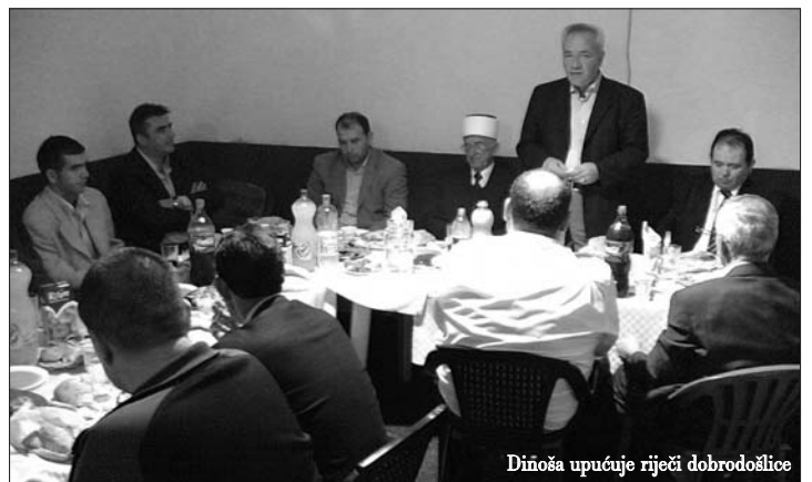
Dinoša upućuje riječi dobrodošlice