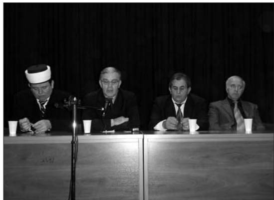
Profesor Hadžić: Veza među muslimanima Crne Gore i BiH je tradicionalna