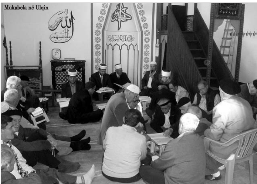
Mukabela në Ulqin