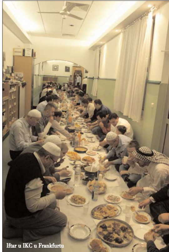
Iftar u IKC u Frankfurtu

Izgradili smo ventilaciju visoku 12 metara, sa velikom ventilacionom haubom (napom) u kuhinji. Iskoristili smo priliku pa smo modernizovali kompletnu kuhinju po najnovijim tehničkim, i ostr-