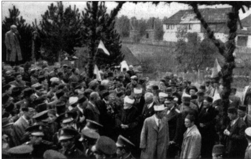
Doček reisu-luleme Fehim ef. Spaha u Bijelom Polju (4. oktobar 1938. godine)

Da bi se upoznao sa vjerskim, vjersko-prosvjetnim, kulturnim i ekonomskim stanjem muslimana, Fehim ef. Spaho je već u prvoj godini svoje visoke službe u svojstvu