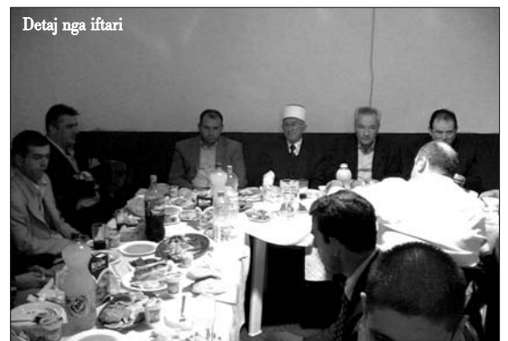
Detaj nga iftari