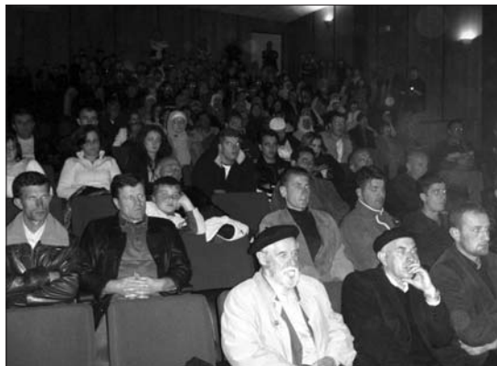
Iz Doma kulture u Tuzima

Tuzi, 19. oktobra – U noći Bedra, nakon teravih namaza u »Čazim-begovoj« džamiji, profesor Mehmedalija ef. Hadžić iz Sarajeva održao je ramazansko predavanje u Domu kulture u Tuzima. Oko hiljadu vjernika iz Tuzi i okoline s pažnjom je pratilo jednočasovno akademsko predavanje profesora Hadžića, inače doskorašnjeg ambasadora BiH u Saudijskoj Arabiji i aktuelnog savjetnika predsjedavajućeg Vijeća ministara BiH. Govoreći o istorijskom značaju bitke na Bedru, Hadžić je kazao