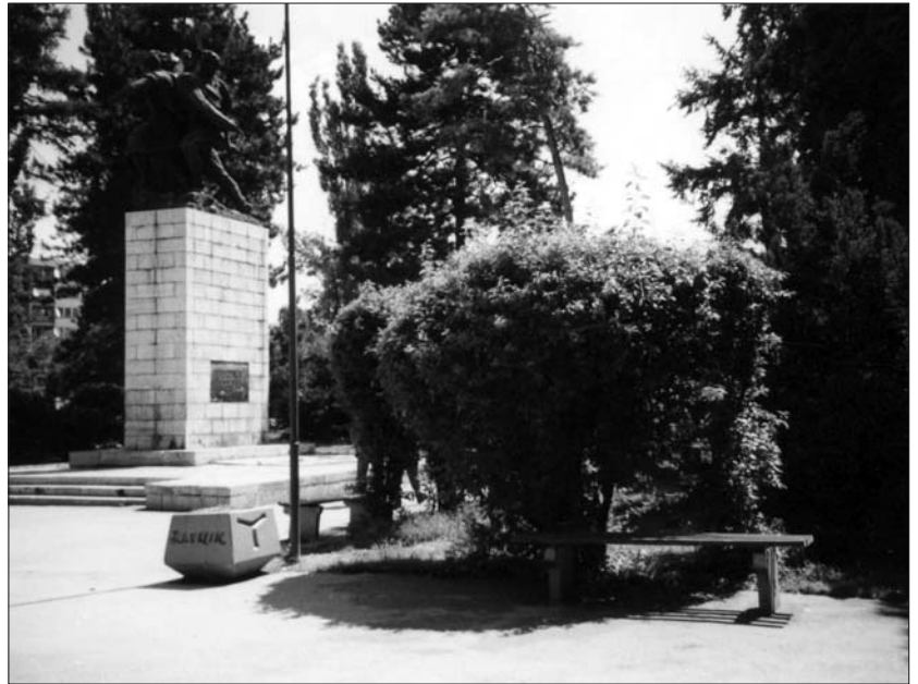
Bjelopoljski park - mjesto nekadašnje džamije iz XVII vijeka

om Zakonu bila je obavezna za mušku djecu od 7-11 godina, a za žensku od 6. do 10. godine. Izuzetak su činila tjelesno i duševno slaba djeca. Sibijan mektebi u kojima se obavljala nastava podizala se u svakoj mahali i selu. U periodu od 1869.god. do 1877. godine u bjelopoljskoj kazi je bilo od 11 do 27 mekteba, a u samom Bijelom Polju bilo ih je tri. Nastava je trajala četiri godine. Pored vjeronauke, učilo se pisanje, računanje, istorija i zemljopis. Predavanja su držana dva puta dnevno. Podaci nam kazuju da je školske 1896/97. godine na području bjelopoljske i vraneške kaze postojalo 20 Sibijan mekteba, od kojih je 6 bilo u samoj varoši Bijelo Polje. Školske 1900/01. u Bijelom Polju je postojao jedan ženski i tri muška mekteba. Svi učitelji u mektebi-