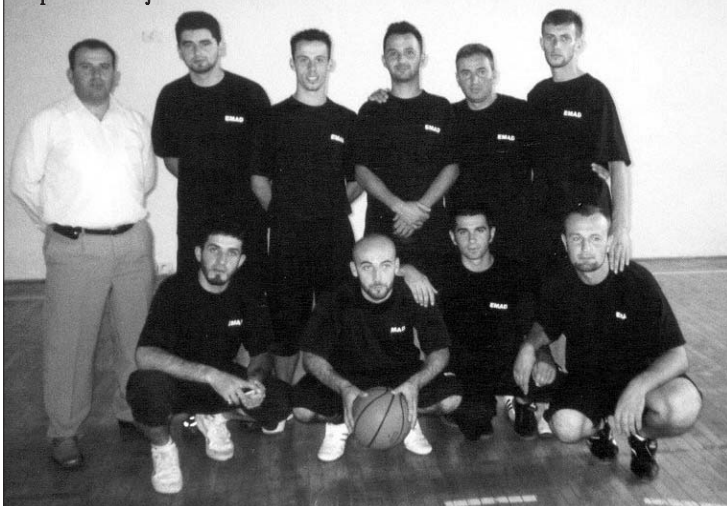
Ekipa Islamske zajednice Crne Gore

U Czinu je 20. avgusta ove godine održana tradicionalna hodžijada. Pored bihačkog muftiluka, koji je bio domaćin hodžijade, učestvovali su i predstavnici Islamske zajednice Crne Gore, kao i predstavnici sarajevskog, zeničkog, travničkog, mostarskog, tuzlanskog, sandžačkog i vojnog muftijstva. Sedamnaest vjerskih službenika iz Crne Gore, dva dana prije početka igara, okupili su se radi priprema u zgradi medrese u Rožajama, da bi se rano u petak uputili prema Krajini. U Sarajevu je napravljen kratak predah da bi se obavio namaz i