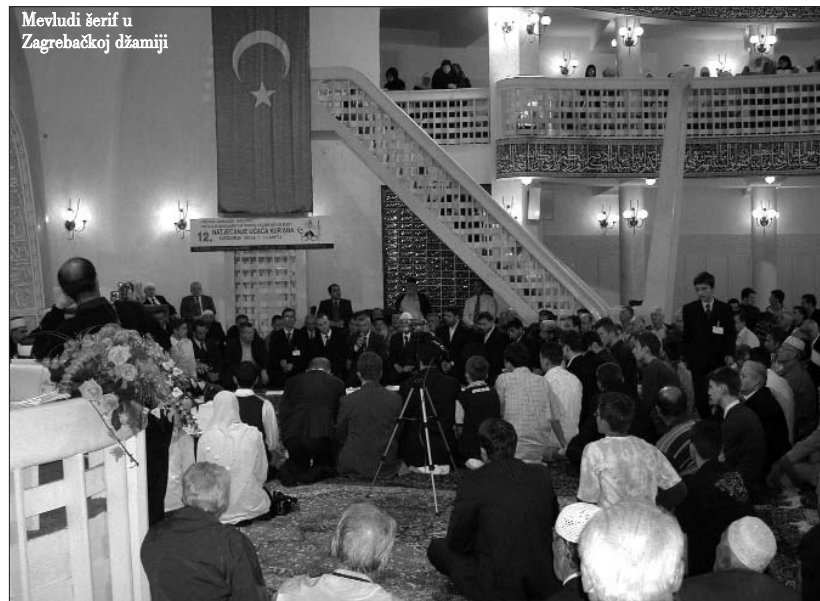
Mevludi šerif u Zagrebačkoj džamiji

U organizaciji Mešihata islamske zajednice Hrvatske, Islamskog centra u Zagrebu i Svjetske organizacije za hifz u zagrebačkom Islamskom centru od 22.-24. septembra održano