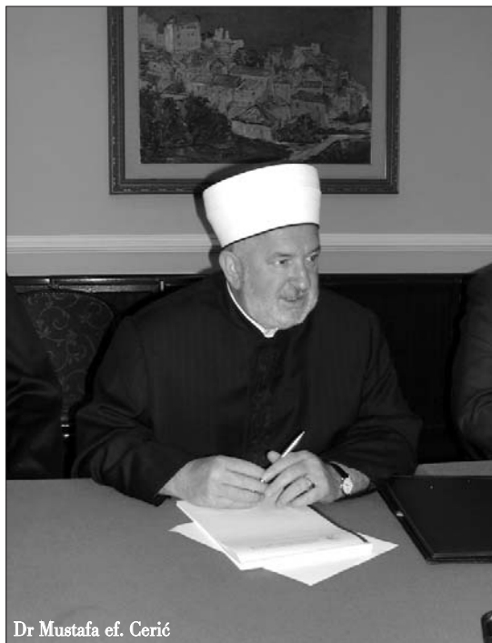
Dr Mustafa ef. Cerić