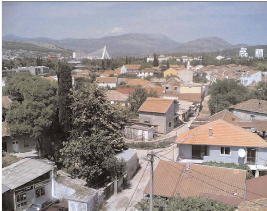
Podgorička Stara varoš