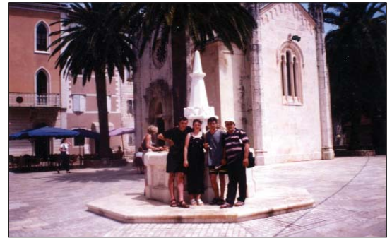
Crkva Sv. Arhandela Mihaila na trgu Belavista u Herceg Novom - lokacija nekadašnje džamije Sultan Bajazit

Odmah po zauzeću Herceg Novog, Jeronim Korner se postarao da u gradu, na razvalinama ove džamije podigne manastir i uz njega crkvu, koja najprije bijaše posvećena blaženoj djevici Mariji, pa kasnije sv. Franju, te je tu smjestio fratre kapucine, dva svećenika i dva monarha a u novije vrijeme crkva je posvećena svetom Leopoldu Bogdanu Mandiću, koji