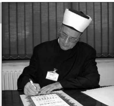
me zagrebačku i Islamsku zajednicu u Hrvatskoj.

Nosilac je aktivnosti u više projekata Islamske zajednice. Posebno je zaslužan za izgradnju džamije u Zagrebu. Gradeći to veliko djelo, on i njegovi suradnici su gradili u isto vrijeme