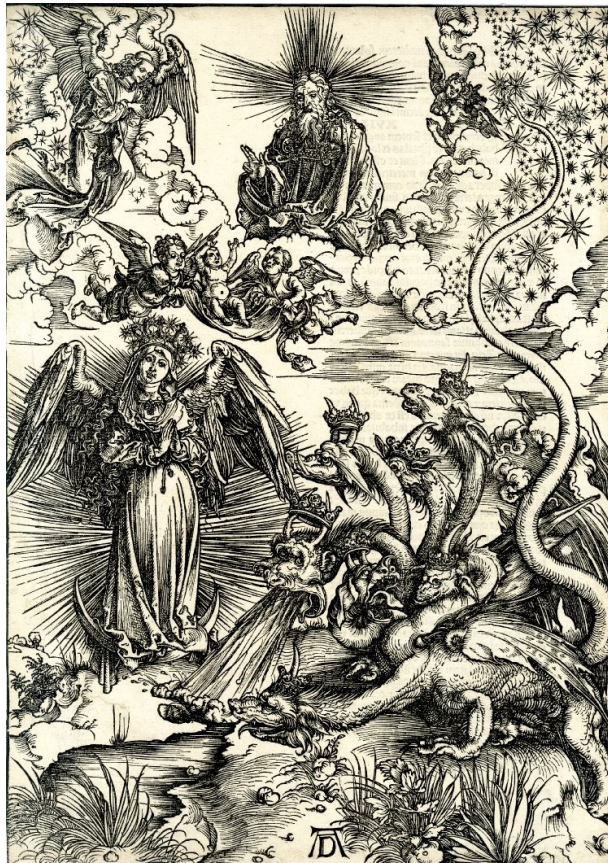
COENA SANCTA REGNI COELORUM