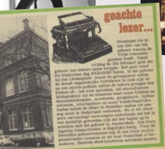
Van 1982 tot 1986 siert een zachtjes wiegend kruis het dak van Paradiso: een verwijzing naar het religieuze verleden van het gebouw. GERT JAN EVELO