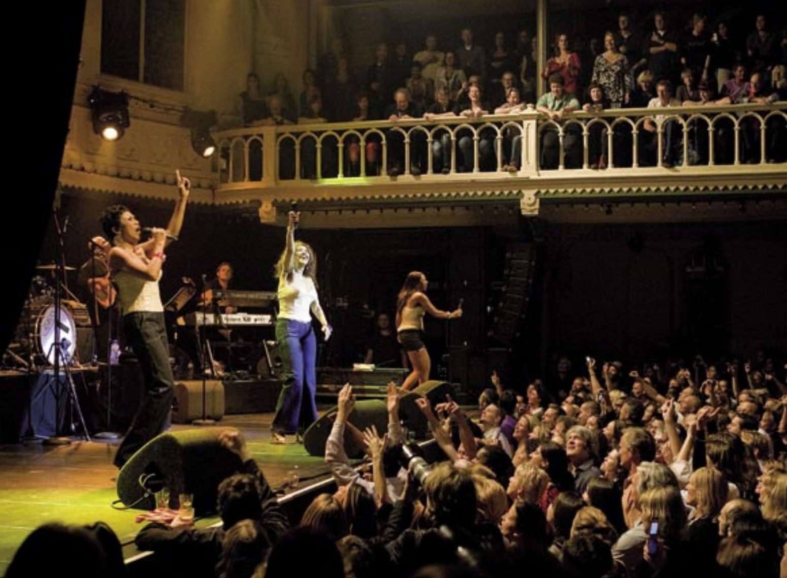
Het enthousiaste publiek omringt The Pointer Sisters in november 2007. Paradiso is groots en intiem tegelijk.