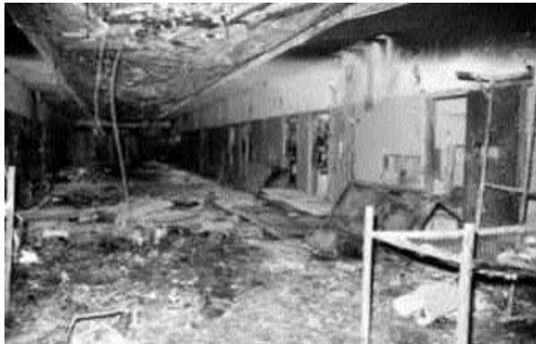
Así quedó el interior del penal de "Libertad" después del motín