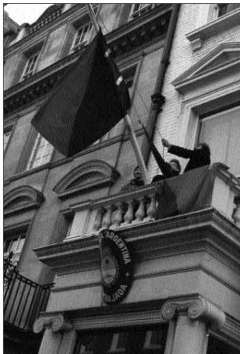
La noche del 10 de enero un grupo de manifestantes ocupó la Embajada argentina en Londres, en solidaridad por la revuelta de diciembre de 2001, e hizo una bandera anarquista. Como consecuencia de esta acción ocho de los participantes fueron arrestados, golpeados y procesados.