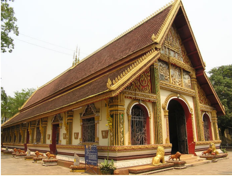
ນະທີ່ວັດສີເມືອງທີ່ແສນຈະສັກສິດ...

ມື້ນີ້ວອນວິໄລງາມເປັນພິເສດ ບໍ່ຕ່າງຫຍັງກັບນາງພ້າທີ່ລ່ອງລອຍລົງມາຈາກສວງສວັນ ເສື້ອສີໄຂ່ທີ່ນາງສວມໃສ່ຊ່າງກົມກືນໄປກັບຜົວພັນທີ່ດູດດັ່ງຍອງຝ້າຍຂອງນາງ ແລະສີ່ນສີແດງນັ້ນກໍຊ່າງເຮັດໃຫ້ຜົວນວນຂອງນາງເປັ່ງປະກາຍ ພາຍໃນອ້ອມແຂນຂອງນາງ