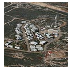
מגרון. המאחז הגדול ביהודה ושומרון