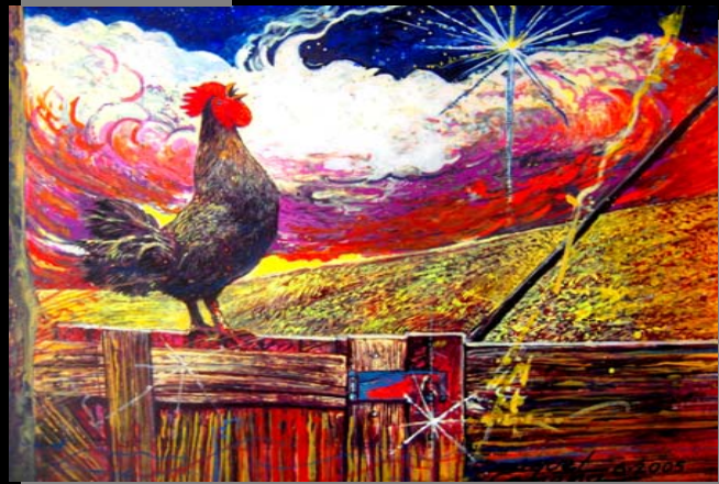
1. El Gallo que Cantó en Belén (8 1/2 x 11") (Estudio Preliminar) Dibujo Tinta-Lápiz y Acrílico. / 2. El Gallo que Cantó en Belén (8 1/2 x 11") Acrílico, pasta de moldear sobre panel sellado con yeso y barniz sin brillo. Julio. 2005, Ponce, PR.