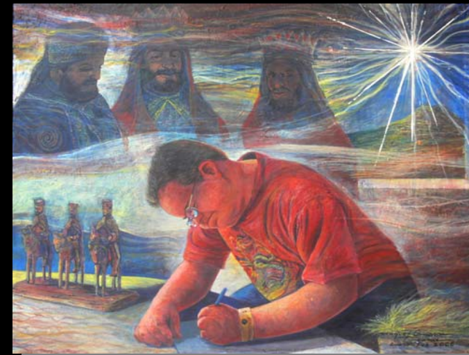
La Carta Los Reyes. (24" x 30") Acrílico-pasta de moldear sobre lienzo / Enero-Feb 2006