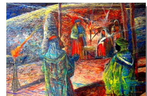
En el Portal de Belén / (16" x 20") Acrílico, pasta de moldear sobre tela sellado con yeso y barniz sin brillo. Junio 2006, Ponce, PR.