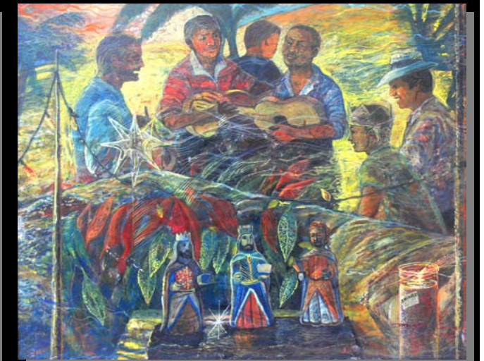
La Promesa de Reyes (21" 11/16 x 18") Acrílico-pasta de moldear sobre mazonite / Dec. 1985