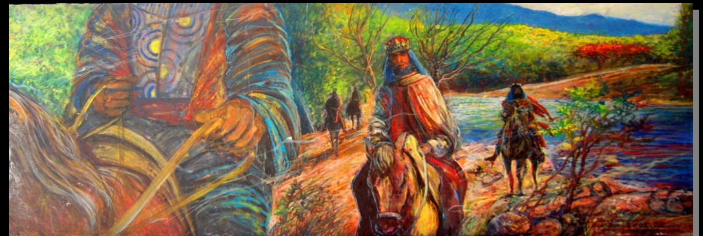
Cabalgata de Los Reyes Magos (11" x 30 3/4") Acrílico, pasta de moldear sobre madera tratada, sellada con yeso y barniz sin brillo. / Dic-2005. Ponce, PR.