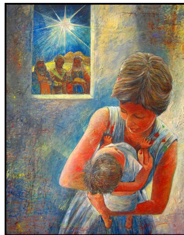
Pequeño Poema de Amor # (30"x 24") Acrílico, pasta de moldear sobre lienzo sellado con barniz sin brillo. Nov. 1993.