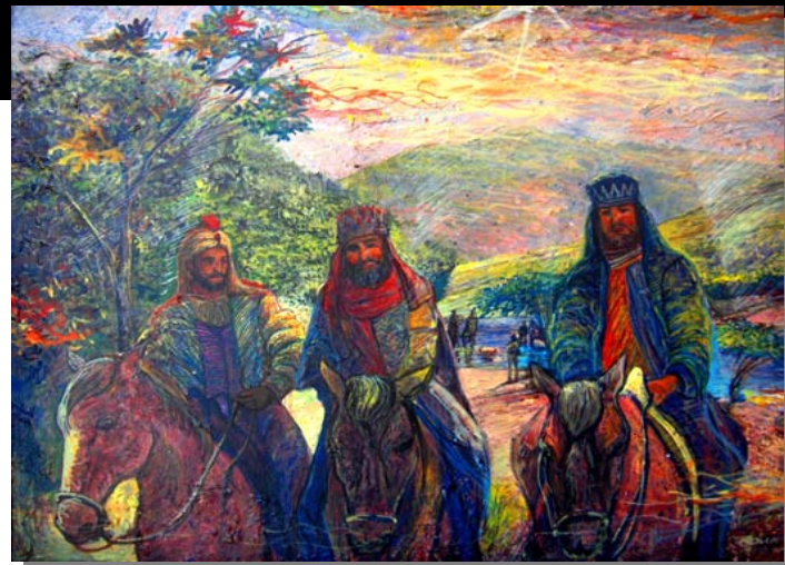
Cabalgata Diurna / Day Time Riding (16"x20") Acrílico, pasta de moldear sobre tela sellado con yeso y barniz sin brillo. May 2006. Ponce, PR.