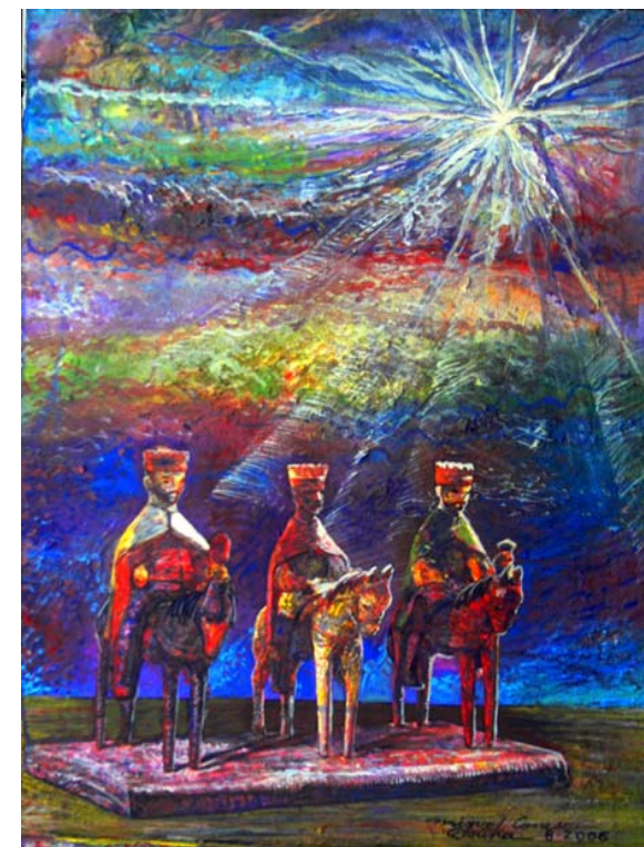
Les Sirvió de Guía la Estrella de Oriente (19" x 24") Acrílico, pasta de moldear sobre mazonite sellado con yeso y barniz sin brillo. Agosto 2006. Ponce, PR.