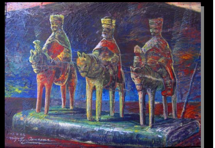
Reyes de Madera # 2 (18"x14") Acrílico, pasta de moldear sobre lienzo. / Enero 2006. Ponce, PR.