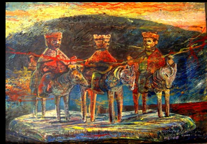
Reyes de Madera # 1 (18"x14") Acrílico, pasta de moldear sobre lienzo. / Enero 2006. Ponce, PR.