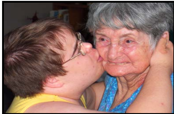
Luis Miguel con su adorada abuela, a quien él llamaba "Lalo". Sept 2005