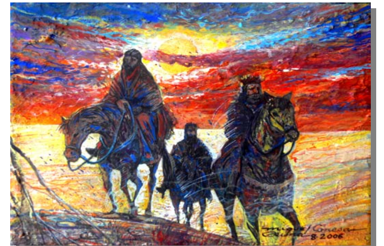
De Tierras Lejanas (9" x 12") Acrílico, pasta de moldear sobre mazonite sellado con yeso y barniz sin brillo. Agosto 2006. Ponce, PR.