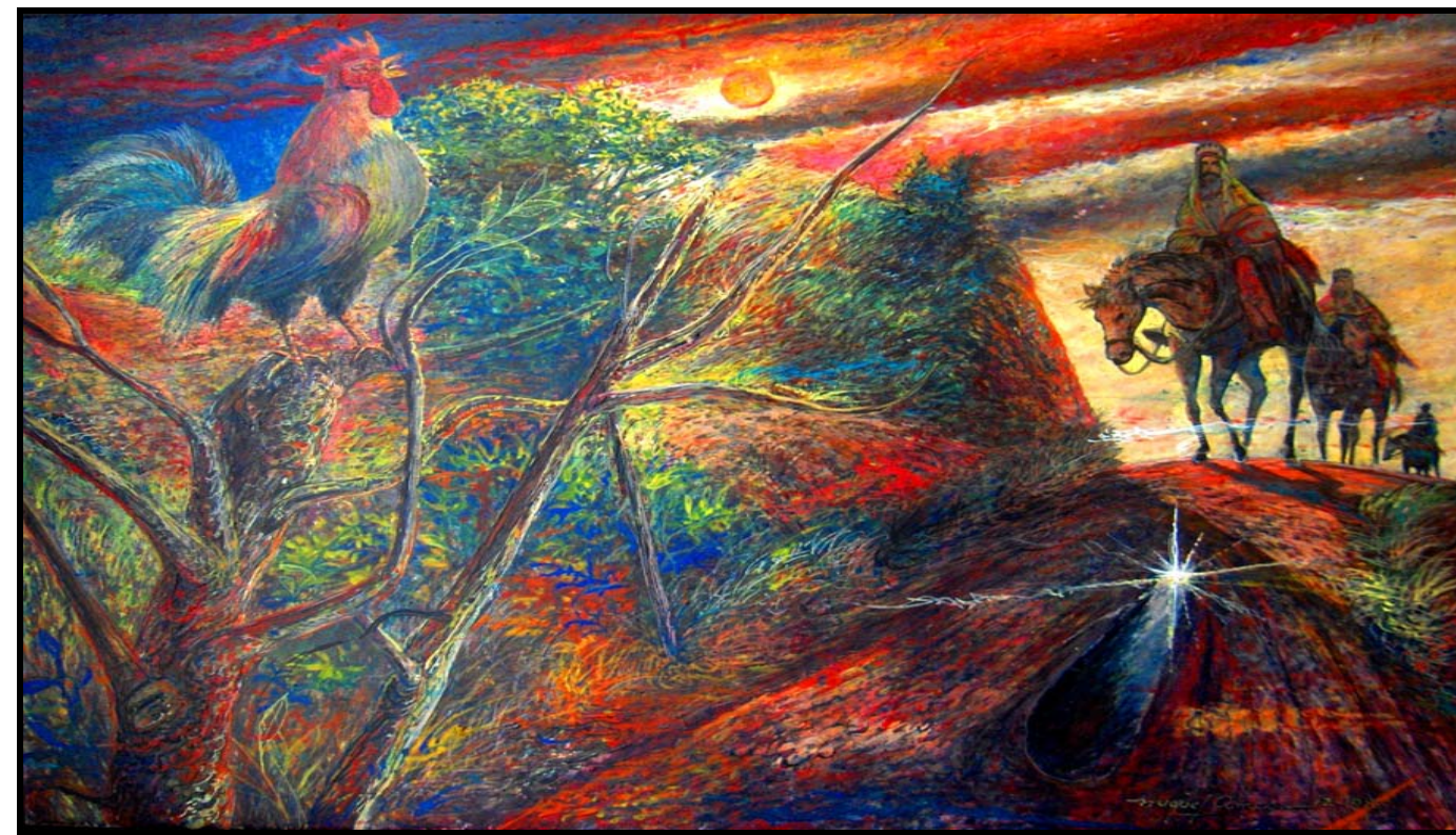
Allí Vienen los Reyes (20"x30") Acrílico, pasta de moldear sobre lienzo / Dec 1989.