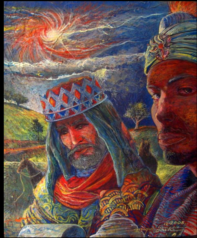
Díptico: 1. Descifrando Los Astros del Cielo / (18" x 14") Acrílico, pasta de moldear sobre tela sellado con yeso y barniz sin brillo. 2. Siguiendo al Cometa Estrella (18" x 14") Acrílico, pasta de moldear sobre tela sellado con yeso y barniz sin brillo. Dic 2005. (Díptico 14" x 18") Diciembre 2005, Ponce, Puerto Rico