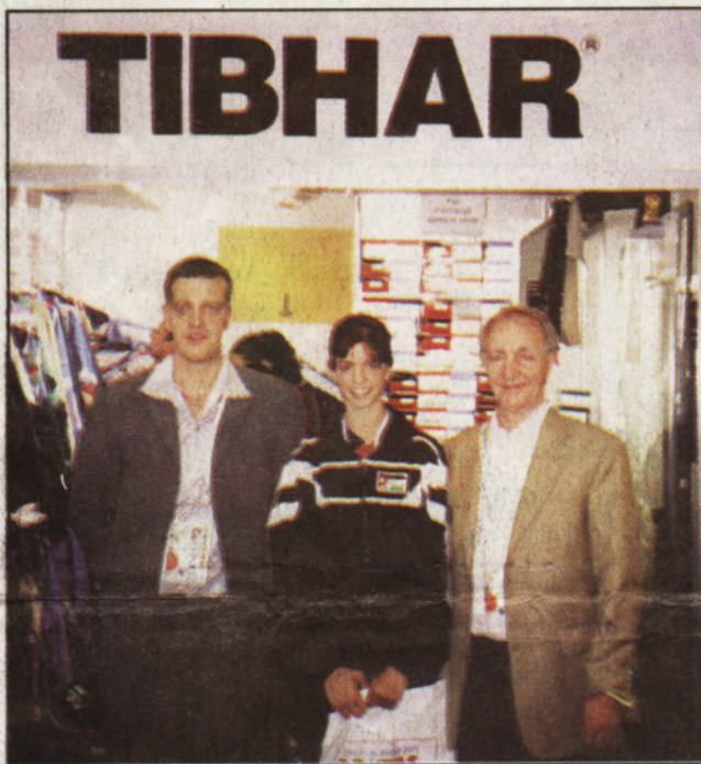
.. وتتوسط مدراء شركة «تبر»

وتناول الكاتب مايكل اندرسون الذي يعمل في مجلة كرة الطاولة ويصدرها الاتحاد الدولي لكرة الطاولة هذه الكلمات في زينة شعبان انها القادمة من الاردن